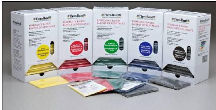
CAJA DE CARTON CON LINEA DE PREPICADO PARA EXTRAER LA BANDA

DISPENSADOR 1.5 MTS X 30 ANCHO DE LA BANDA 14 CM