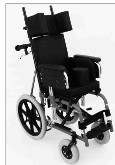
* Tamaño corto.