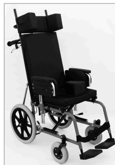
* Tamaño normal.

Marco fabricado en acero de 1". Silla plegable. Disponible en dos tamaños: marco normal y corto (niños) Pintura electrostática al polvo. Apoya brazo (corto o largo) regulable en altura y desmontable. Frenos regulables, con sistema retráctil automático. Pienera fija. Apoya pie de paleta regulable en altura. Inclinación regulable de respaldo (0° a 90°) Ancho del asiento a medida.