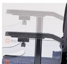
Apoya brazos ajustables en altura