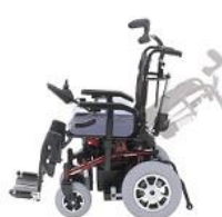
Reclinación eléctrica del respaldo de 85°-135°