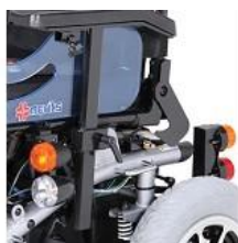
Sistema de luces