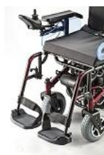
Piñeras y apoya brazos desmontables