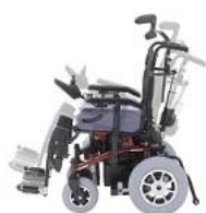
Ajuste eléctrico de basculación de 3,5°-16,5°