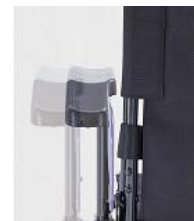
Apoya brazos ajustables en ancho